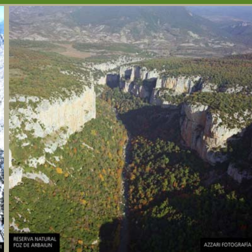
RESERVA NATURAL TOZ DE ARBAIUN AZZARI FOTOGRAFIA