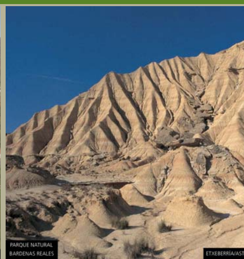
PARQUE NATURAL BARDENAS REALES ETXEBERRIA/ASTRAIN