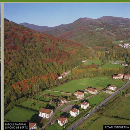
PARQUE NATURAL SEÑORIO DE BERTZ